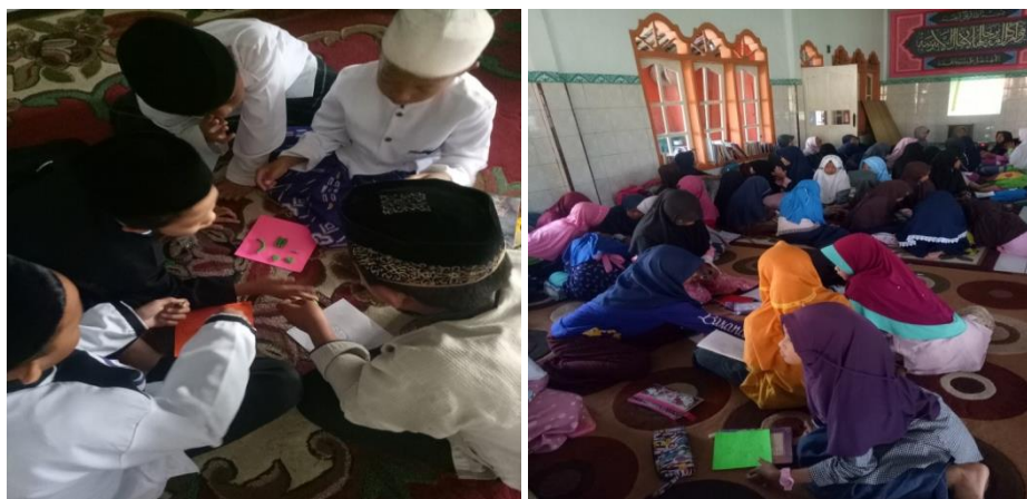
Gambar 2. Peserta melakukan proses Praproduksi