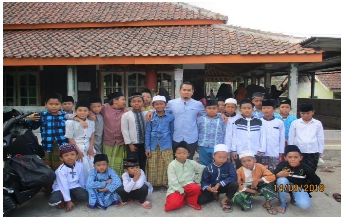
Gambar 1. PP Roudlotul Mudaritsin tempat pengabdian kepada masyarakat