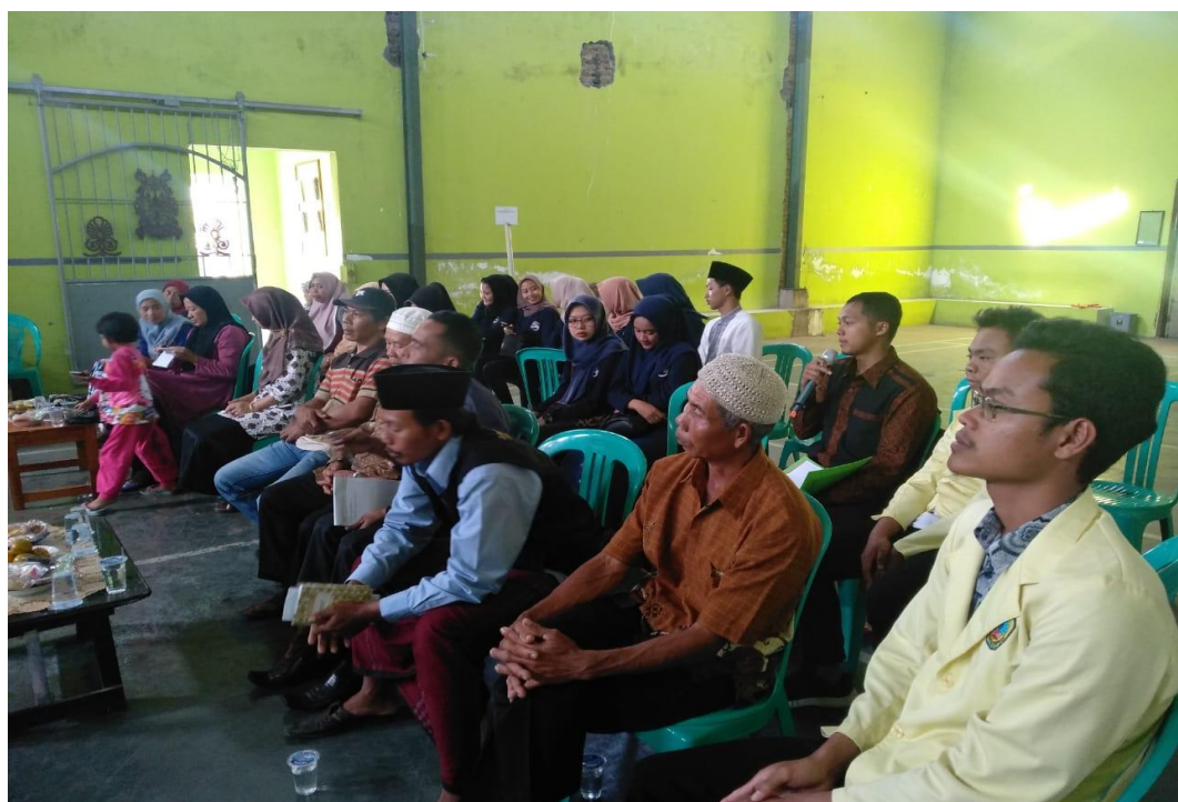
Gambar 03 : Kegiatan Sosialisasi