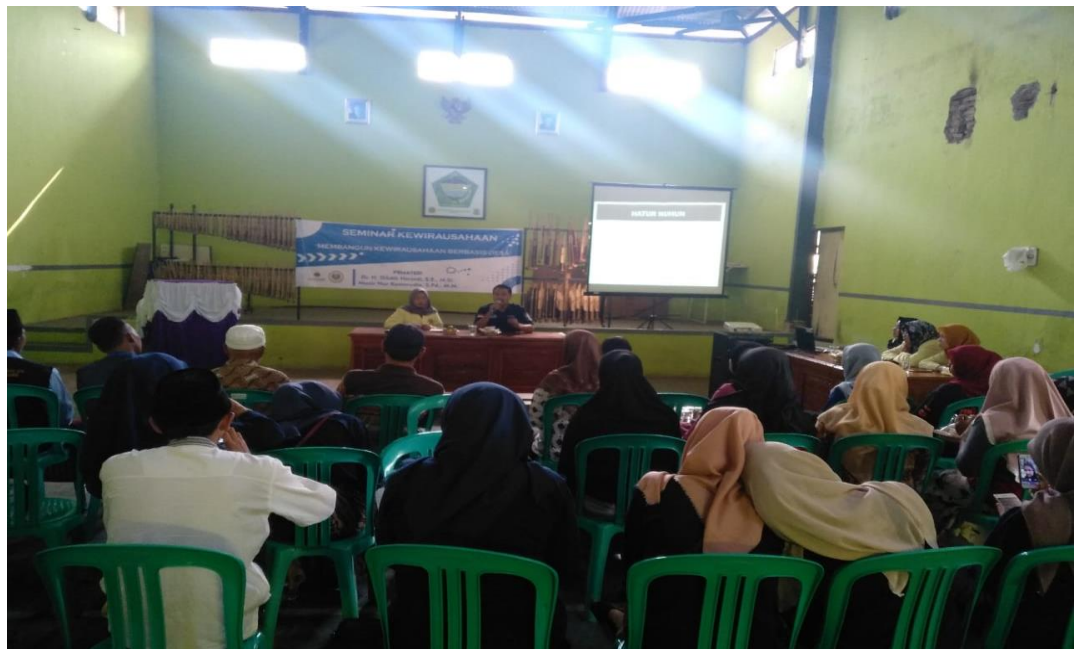
Gambar 02 : Kegiatan Sosialisasi

Dengan adanya masalah baru yang timbul perlu diadakannya pendampingan yang lebih mendalam lagi baik dalam segi peningkatan kualitas SDM maupun yang lainnya.