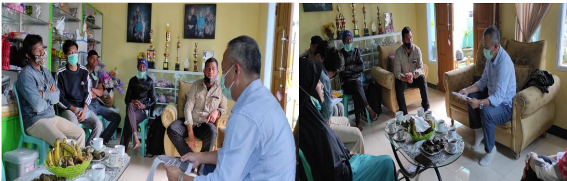
Gambar 2. Bimbingan Manajemen Pengelolaan dan Keuangan kepada Pengurus Bank Sampah LPK Sukses Mandiri

Foto kegiatan pendampingan pengelolaan bank sampah LPK Sukses Mandiri Cimaung Kab Bandung sebagai berikut: